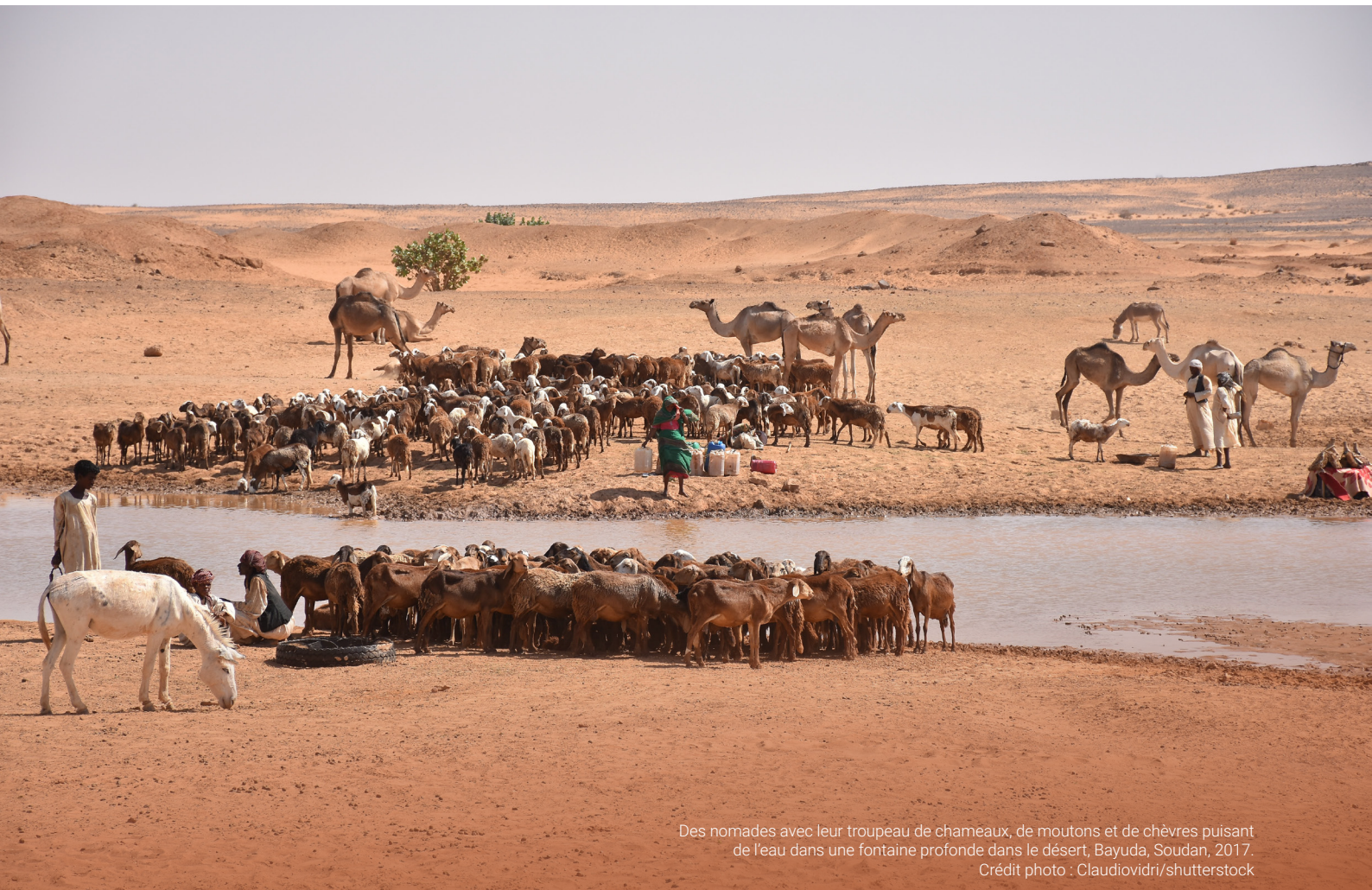
Des nomades avec leur troupeau de chameaux, de moutons et de chèvres puisant de l'eau dans une fontaine profonde dans le désert, Bayuda, Soudan, 2017.

Si les gouvernements ont un rôle évident à jouer dans ce type d'interventions, les interfaces relationnelles entre le gouvernement et les autres acteurs s'appuyant sur les efforts existants doivent être renforcées. En outre, pour remédier à l'exclusion des femmes et des jeunes des instances de résolution des conflits et de prise de décision, il sera crucial de promouvoir leur participation à ces processus, en veillant à ce que leurs voix soient entendues et leurs préoccupations prises en compte.