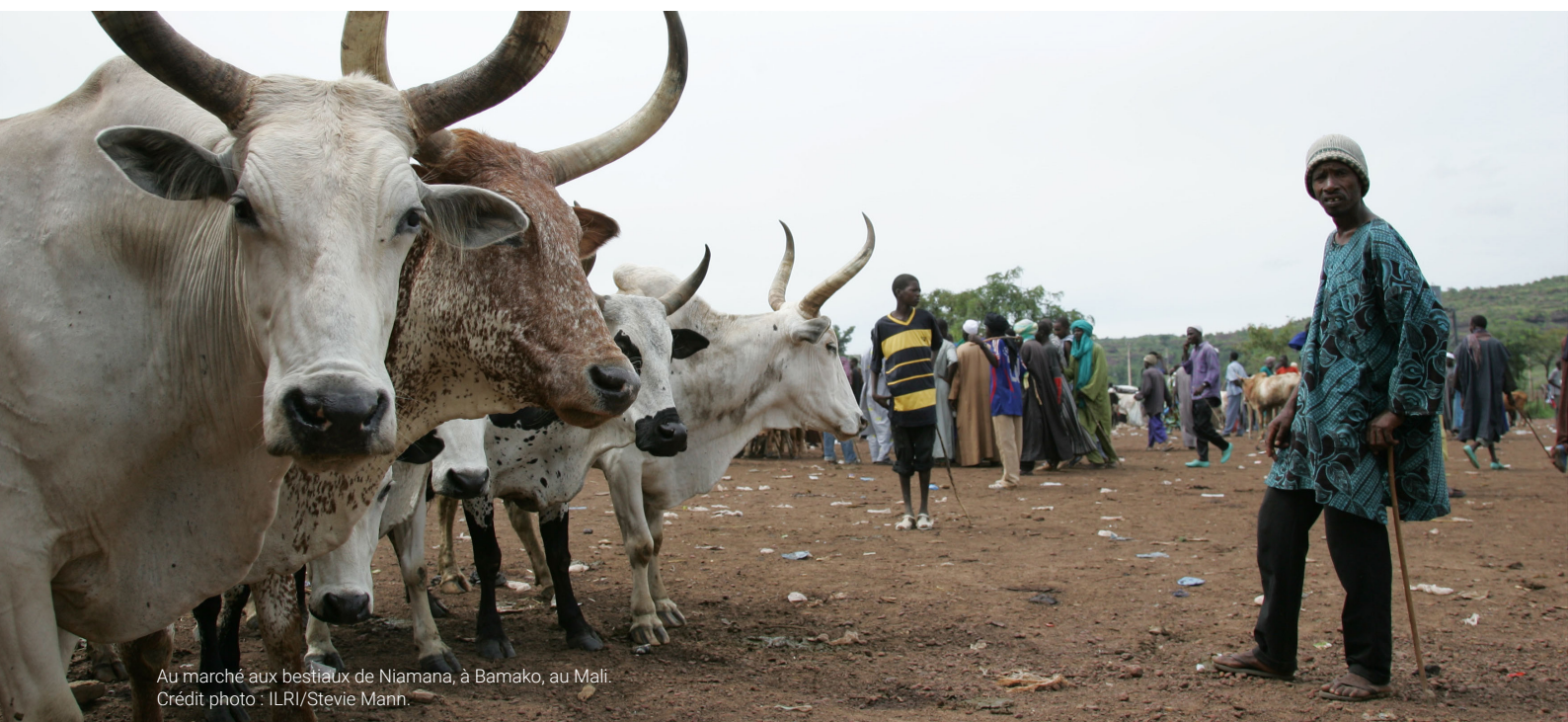
Au marché aux bestiaux de Niamana, à Bamako, au Mali.

Vingt-quatre discussions de groupe réunissant entre 6 et 15 personnes ont été organisés au Nigeria, dix au Soudan et six au Mali en raison de problèmes de sécurité. Au moins huit entretiens individuels (KII) mixtes ont également été menés dans chaque pays. Des outils d'évaluation participative ont été utilisés pour lancer et structurer les discussions, notamment la cartographie des relations entre les parties prenantes, des calendriers et des arbres de conflit.